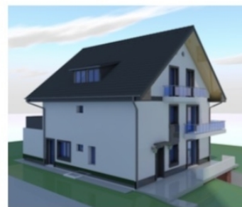
Utcafront felüli képek