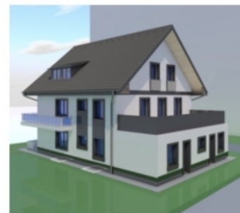
Hátsó kert felüli képek