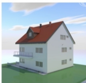
Hátsó kert felüli képek